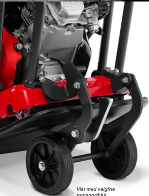
Vist med valgfrie transporthjul